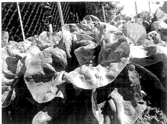
Komposzt tesztelés biokertben