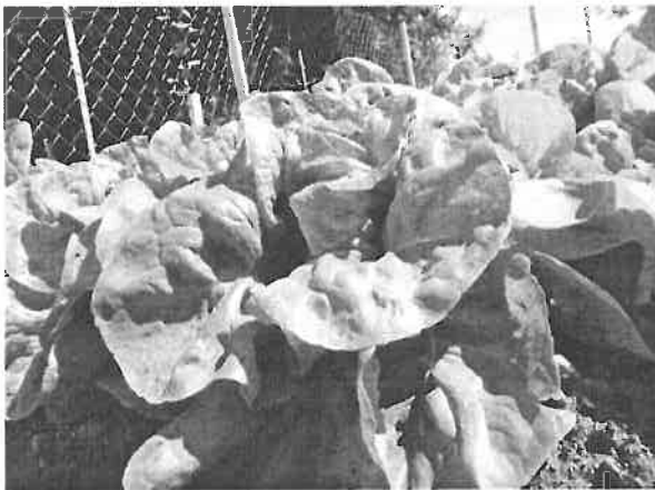
Komposzt tesztelés biokertben

A társaság 2019. évben 5.500 eFt árbevételt tervez komposzt értékesítésből.