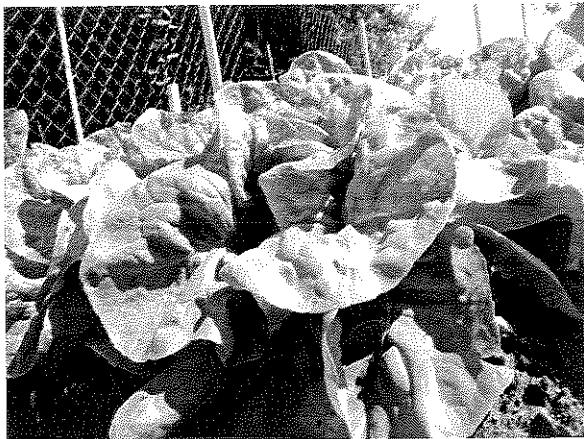
Komposzt tesztelés biokertben

A komposzt értékesítésből származó bevétel 2018. évre várt összege 6.000 eFt, 2018. I. félévben elért bevétel: 1.424 E Ft (47,47%) Az időarányos elmaradás oka az, hogy a komposzt értékesítés jellemzően a mezőgazdasági munkákhoz kapcsolódóan, az év második felében megy intenzívebben.