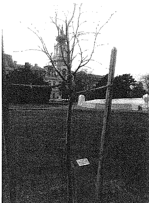
Szent Márton templom helye 2014.március