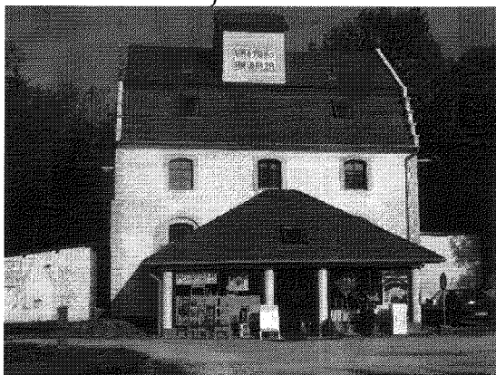
A magtisztító

1. Az értéktárba felvételre javasolt nemzeti érték fényképe vagy audiovizuális dokumentációja