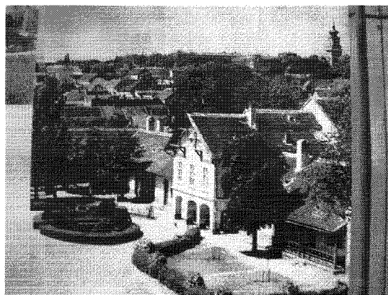
A tanintézet udvari homlokzata (reprodukció – szakoktatás-történeti tábló)