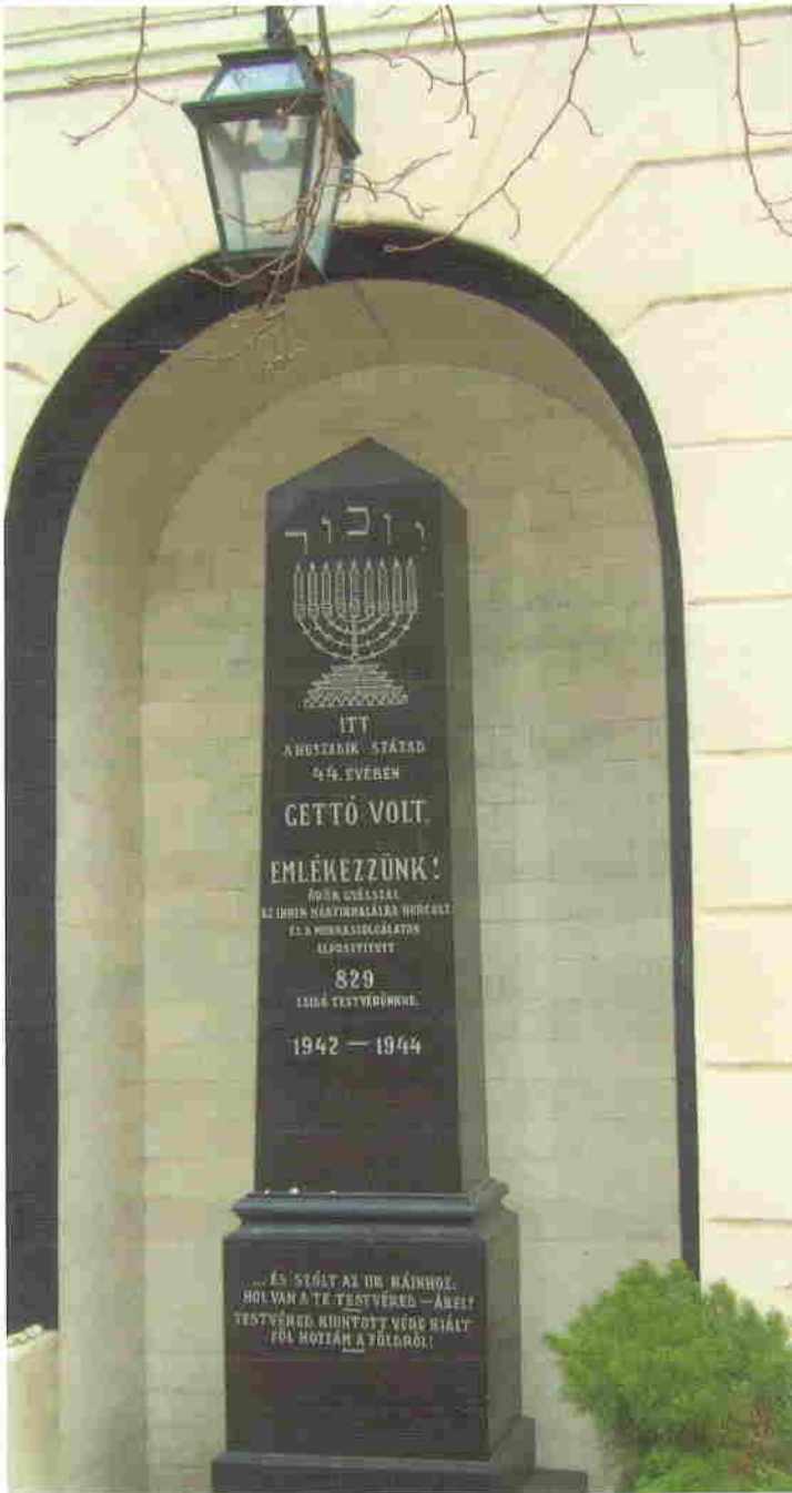
Az 1970-es évek elején felállított emlékmű