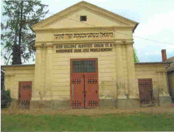
A keszthelyi izraelita temető ravatalozója