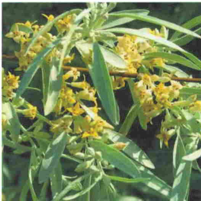
Közönséges keskenylevelű olajfa