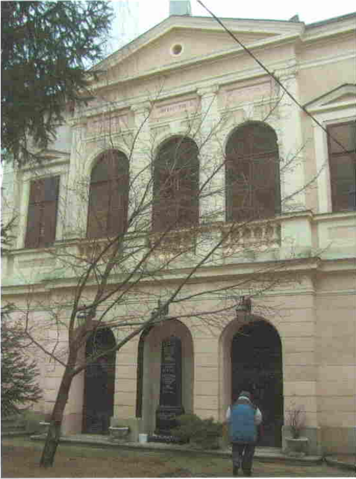
2019. január 31. A zsinagóga homlokzata