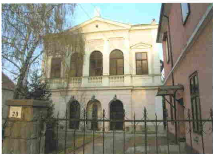
A zsinagóga mai állapotában