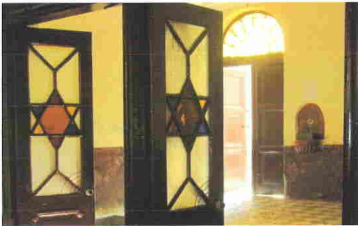
Bejárat kapu és ajtó