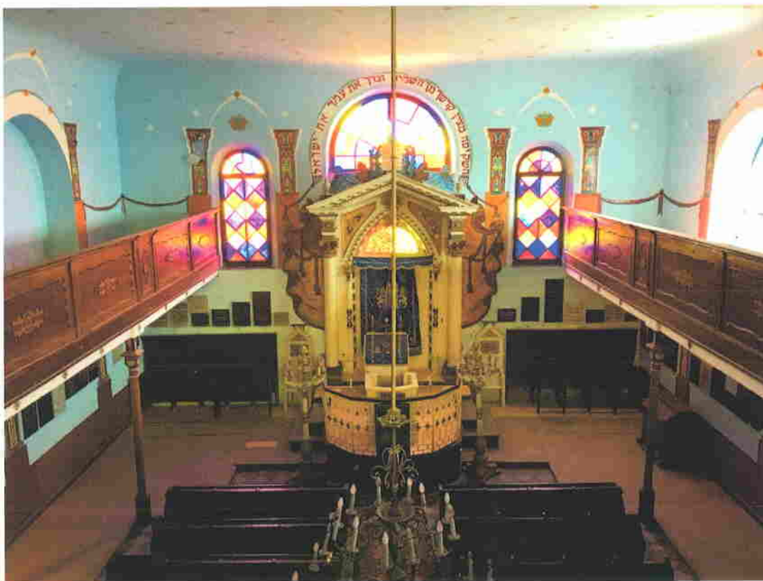
A keszthelyi zsinagóga enteriőrje a női karzatról