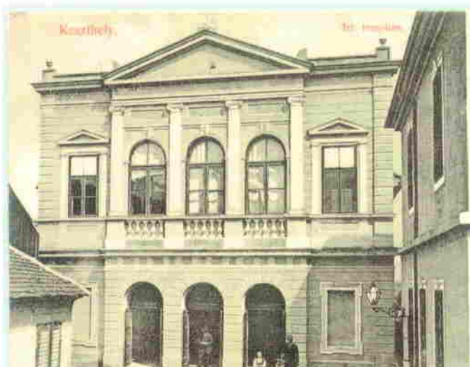
Az 1894-ben átalakított izraelita templom (balról a kántor, jobbról a rabbi lakása)