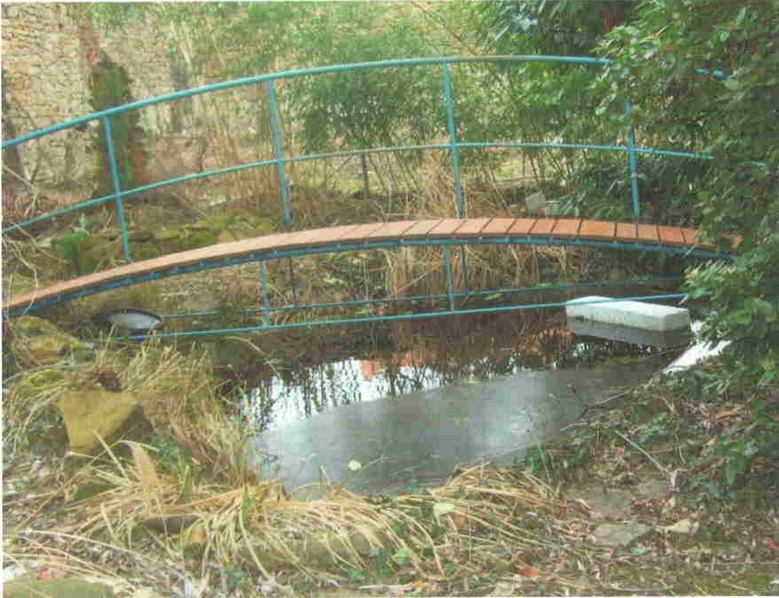
„Tibériás-tó” és „forrása”