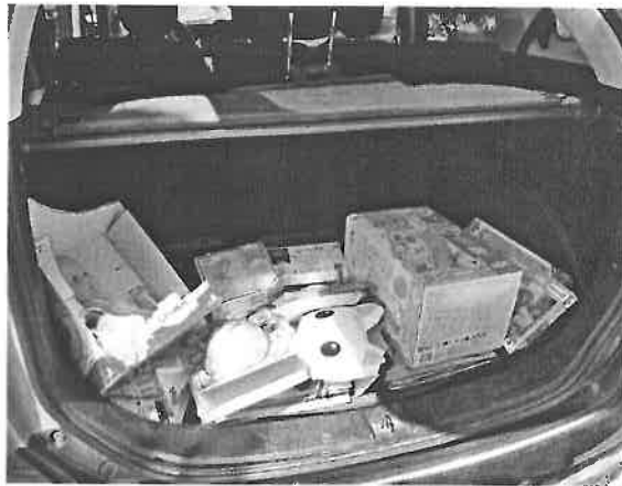
A Müller Áruház adománya

Rendszeresen fogadunk és közvetítünk adományt is: bútorokat, háztartási eszközöket, ruhát, játékokat, pelenkát, gyógyászati segédeszközöket, tartós élelmiszert. Ebben együttműködtünk nem csak hozzátartozókkal magánszemélyekkel, hanem társintézményekkel, mint a Magyar Máltai Szeretetszolgálat, a Magyar Vöröskereszt és a Caritas helyi szervezete, illetve a Müller áruház, ahonnan játékokat kaptunk.