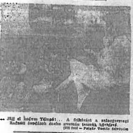
... Azonban a Napfényes Ura ...