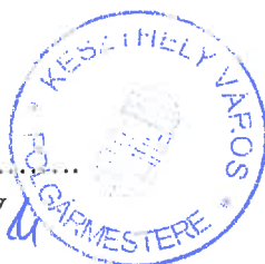
Dr. Tóth Gergely polgármester