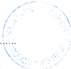
Dr. Tóth Gergely polgármester