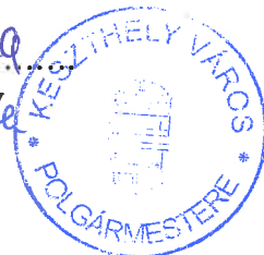
Dr. Tóth Gergely polgármester