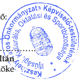
Rizsányi Zoltán bizottság elnöke