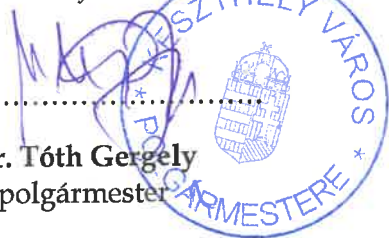
Dr. Tóth Gergely polgármester