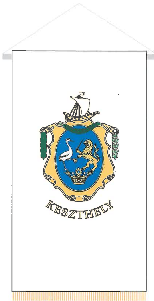
Keszthely város lobogója