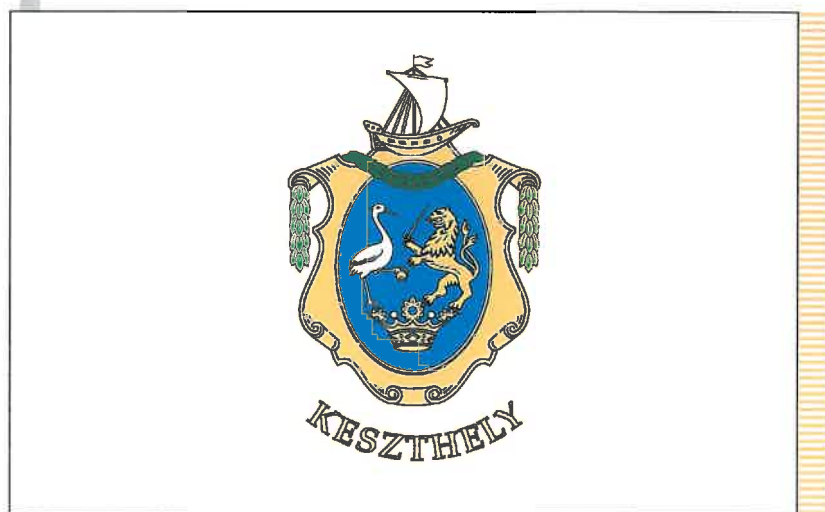
Keszthely város zászlaja