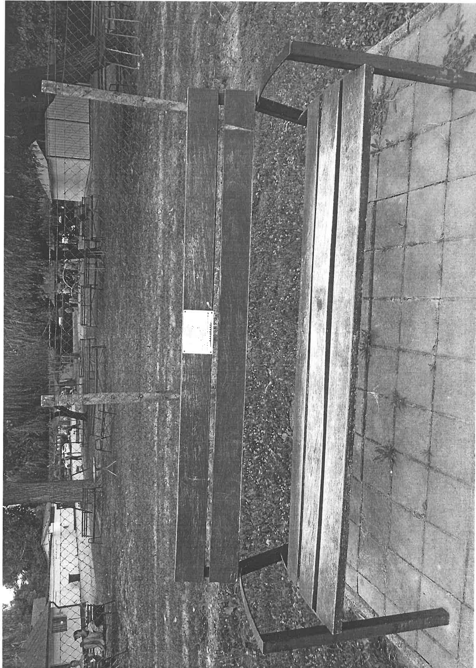
2. 12. HEUTELET