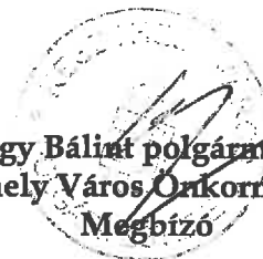
Nagy Bálint polgármester Keszthely Város Önkormányzata Megbízó