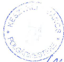
Nagy Bálint polgármester