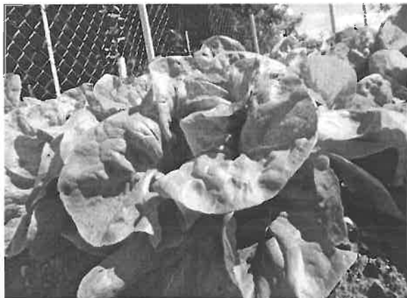
Komposzt tesztelés biokertben

A komposzt értékesítésből származó bevétel 2020. évre várt összege 3.500 eFt, 2020. I. félévben elért bevétel: 816 E Ft (47%) Az időarányos elmaradás oka az, hogy a komposzt értékesítés jellemzően a mezőgazdasági munkákhoz kapcsolódóan, az év második felében megy intenzívebben. Ezen kívül a járványhelyzet is közrejátszott.