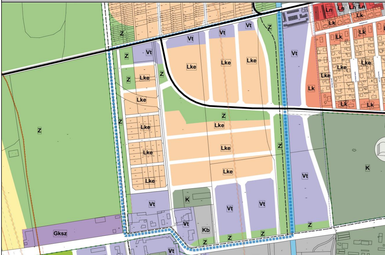
Kivonat a hatályos szabályozási tervből